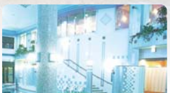
宜野座村2号サーバーム