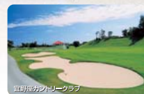
宜野座村ゴルフクラブ