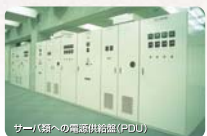
サーバ(箱への電源供給器(PDU))