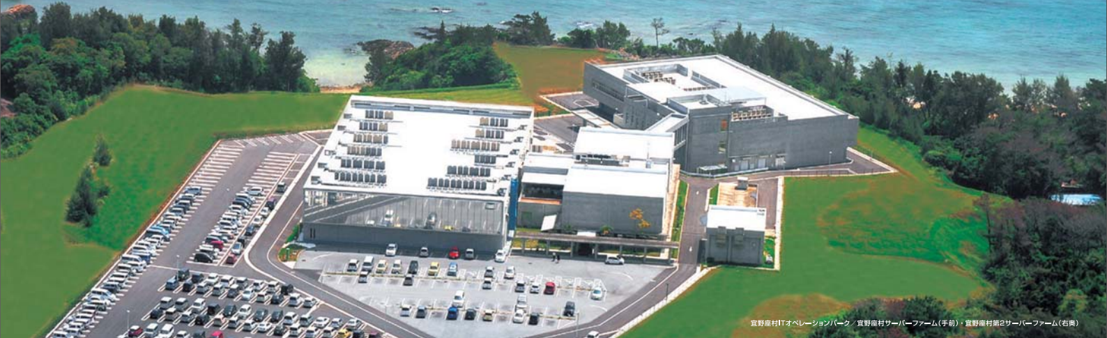
宜野座村ITオペレーションパーク / 宜野座村サーバーム(手前) / 宜野座村2号サーバーム(右奥)

ビーチパーティーをしたり「かなんタラシ沖縄」で疲れを癒したり村内の運動施設を利用して気分も体もリフレッシュ。仕事のストレスや疲れを「沖縄らしい環境」と「やんばらしい雰囲気」の中でゆったりと暮らす。